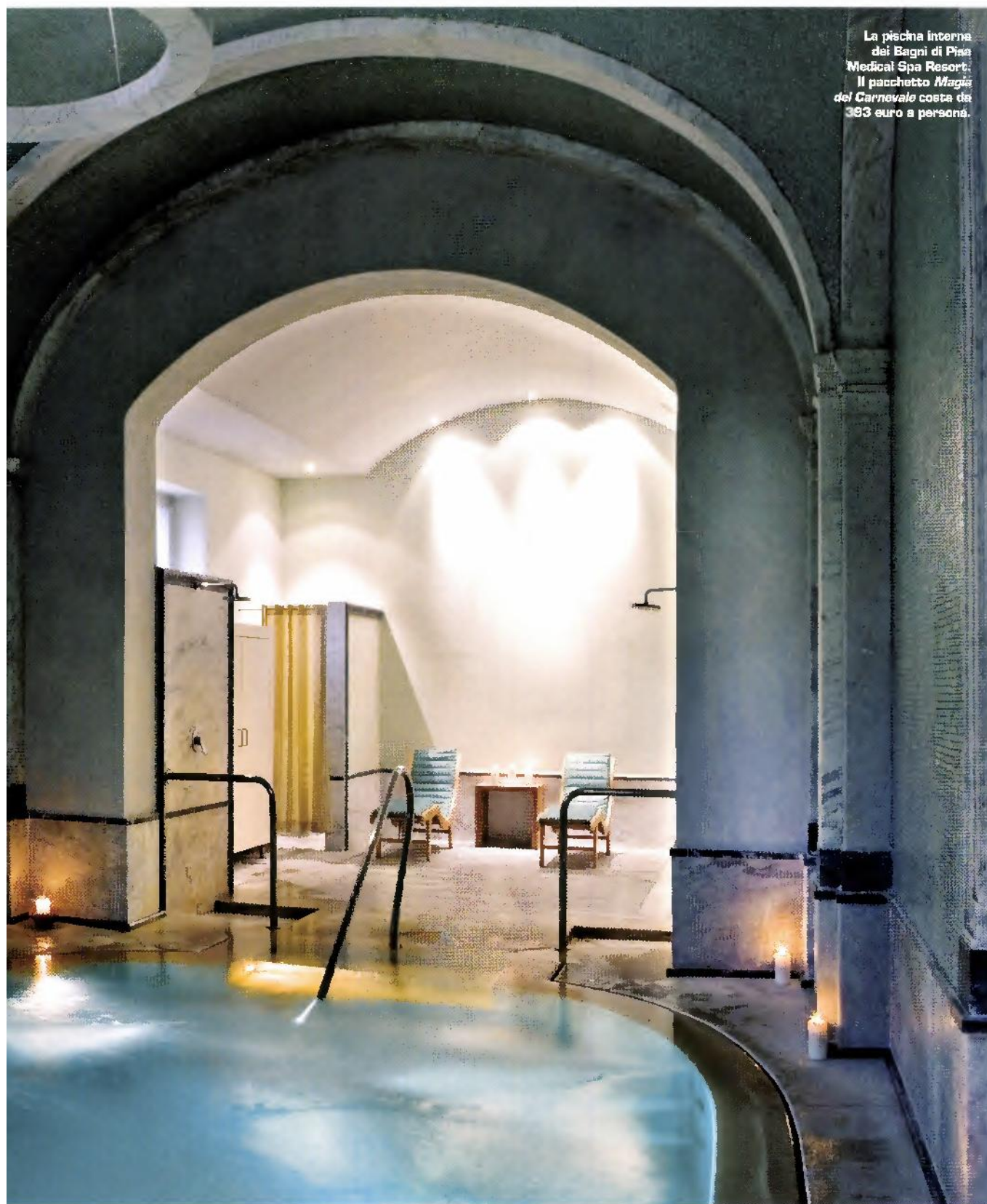
La piscina interna dei Bagni di Pisa Medical Spa Resort. Il pacchetto Magia del Carnevale costa da 393 euro a persona.